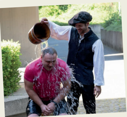
Gautschfest der Medientechnologen/-innen Druck