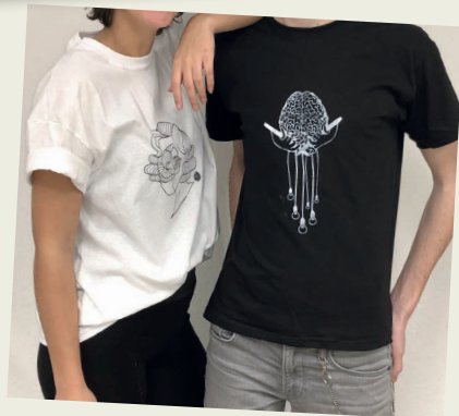
Abi-T-Shirt, Entwurf von David Felzen