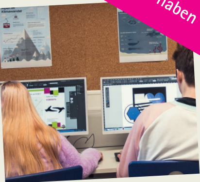
Gestaltung des vorliegenden Flyers: Projekt der Klasse 13 des Beruflichen Gymnasiums